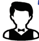
ピースフルサポート